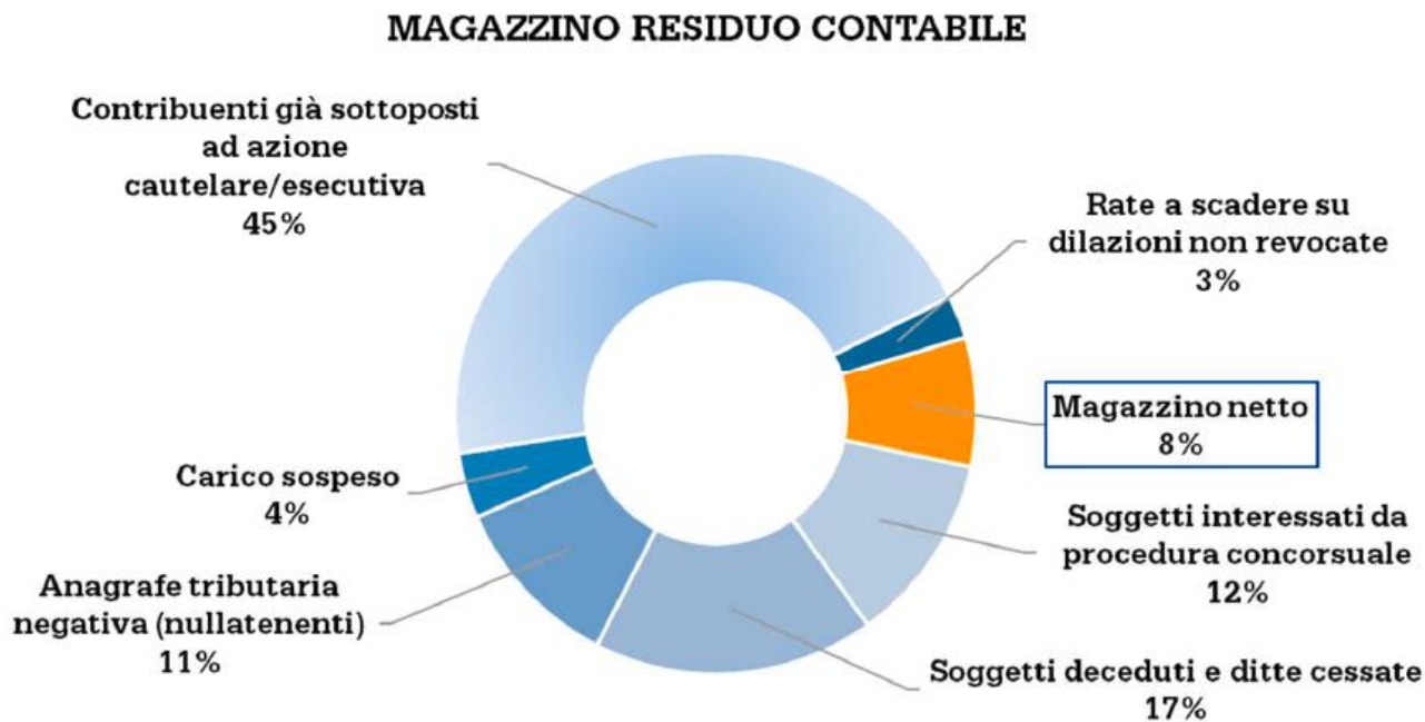
Grafico 2 - Magazzino residuo contabile